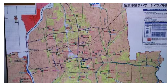
佐賀市洪水ハザードマップ