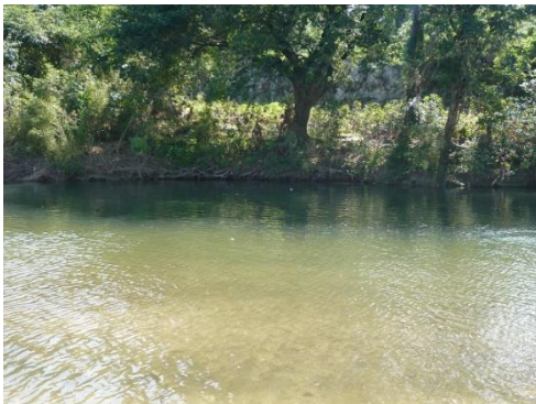
カーブの外側の様子